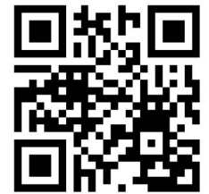
Download des Videos Basisanwendung Selbstheilung https://youtu.be/5BChzHP8vNs