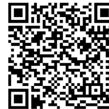
Download für Bestellformular des Persönlichen Mandalas

Das Persönliche Mandala kann bestellt werden bei der Schneider GmbH, DE-71134 Aidlingen, Böblingerstr. 1, schneider@lebenstransfer.de, Fax 0049-(0)7034-61213